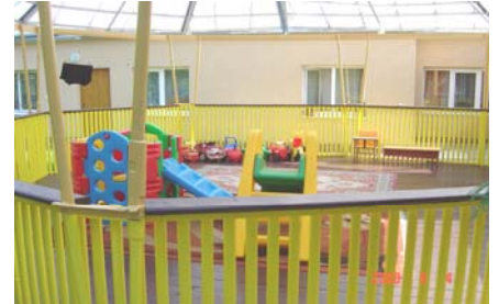
Klaar om te spelen