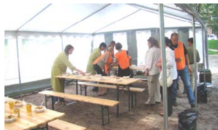
De Party tent wordt klaargemaakt en dankbaar gebruikt