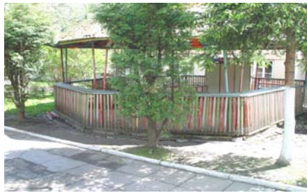
Het oude Paviljoen