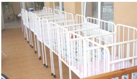
10 kinderbedjes voor op het balkon