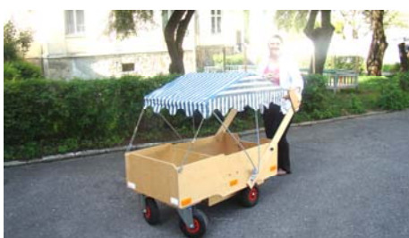
Bolderwagens en speelgoed