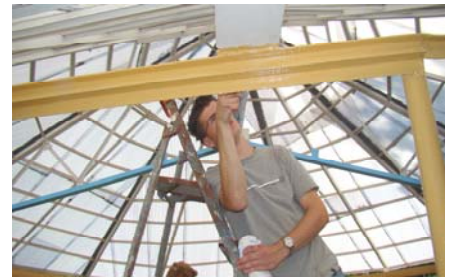
Het vernieuwde dak