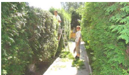
Ook de tuin krijgt een beurt