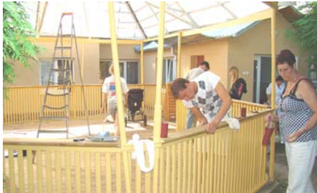
De nieuwe balustrade