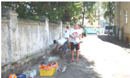
De oude muren worden aangepakt