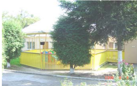
Het vernieuwde Paviljoen