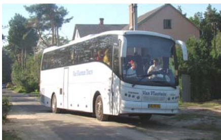
Met de bus van Van Vlastuin