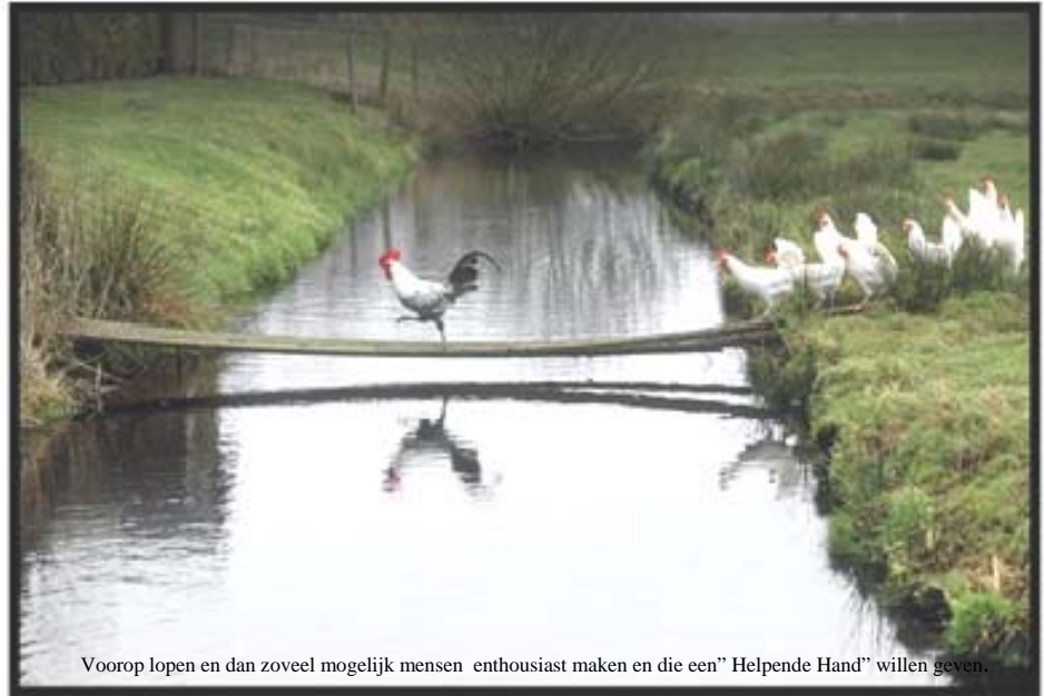
Voorop lopen en dan zoveel mogelijk mensen enthousiast maken en die een "Helpende Hand" willen geven.