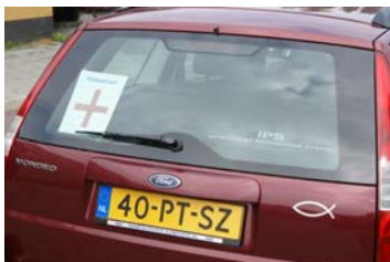
Humanitair kruis voor en achter op de auto

Maar soms is het best leuk, eenmaal zei een beambte "Ah Nederlander, Ajax Super" en bij "Ajax super" deed hij z'n duim omhoog. Ik ben geen voetbal fan, maar zo helpt Ajax ons ook nog een beetje.