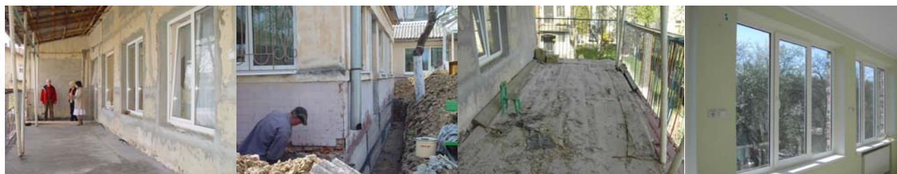
Nu het balkon nog, waar de kinderen in bedjes buiten staan als het goed weer is

De werkzaamheden in het Kinderhuis zijn weer in volle gang, het is fijn om te zien dat alles wat gerenoveerd wordt ook echt goed gedaan wordt. Bij de derde afdeling zijn de werkzaamheden wat meer geworden omdat de fundering vocht doorliet en dit weer via de muur de vernieuwde binnenmuur aantastte. Dus er moest een diepe gleuf naast het gebouw gegraven worden om de fundering waterdicht te maken. Maar stap voor stap wordt het allemaal erg mooi, tot grote dankbaarheid van de Directrice en haar medewerkers. Fijn dat we zo met z'n allen deze kinderen kunnen helpen aan een goede en gezonde woongelegheden.