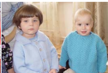
Nieuwe truitjes uit Holland