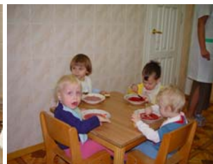
Elke dag rode kool soep